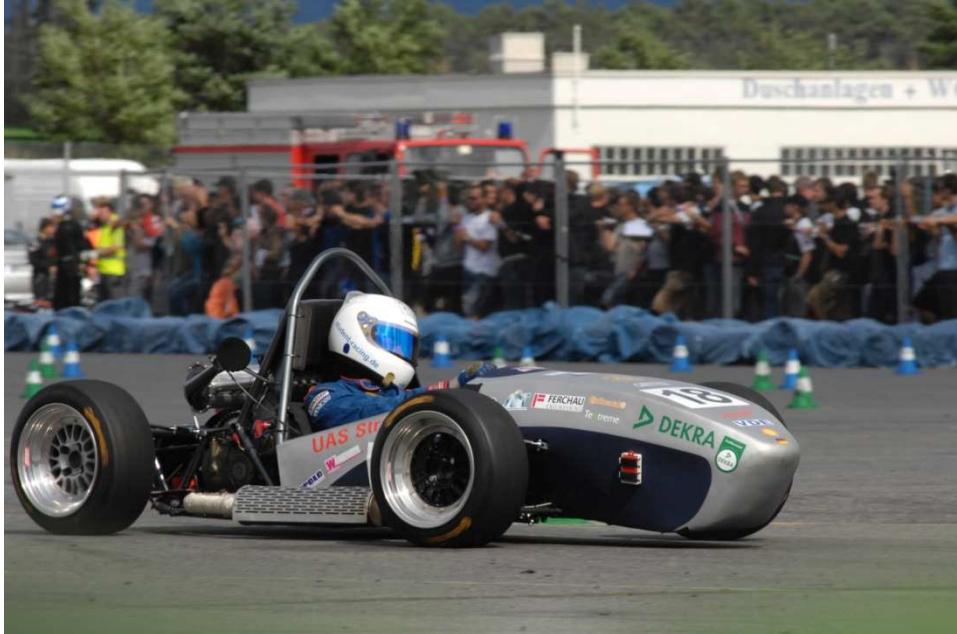
Bildunterschrift 3: PARTsolutions beschleunigt den Konstruktionsprozess beim Formula Student Team Baltic Racing.