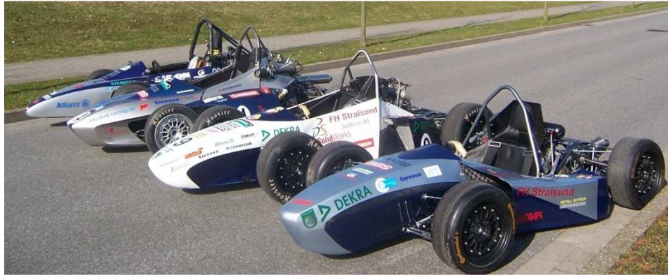
Bildunterschrift 1: CADENAS geht als Sponsor des Baltic Racing Teams an den Start.