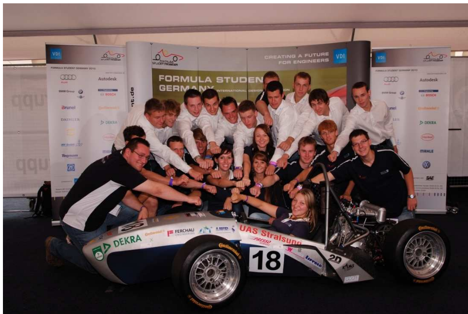
Bildunterschrift 2: Ein starke Team für Formula Student – Das Baltic Racing Team aus Stralsund.