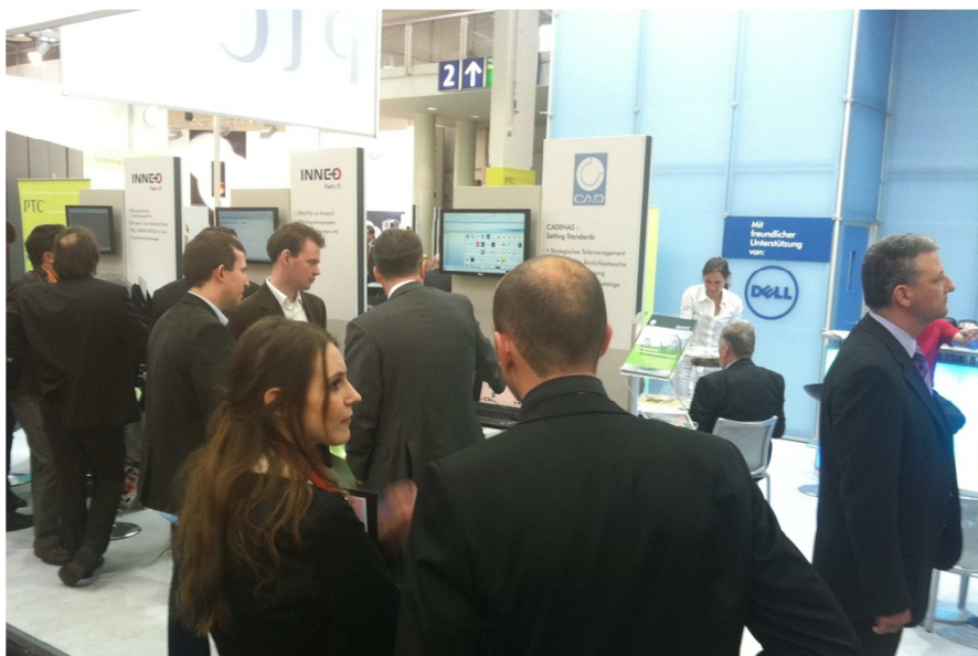
BU2: CADENAS präsentierte auf der Hannover Messe 2011 das Strategische Teilemanagementsystem PARTSolutions am Partnerstand von PTC.